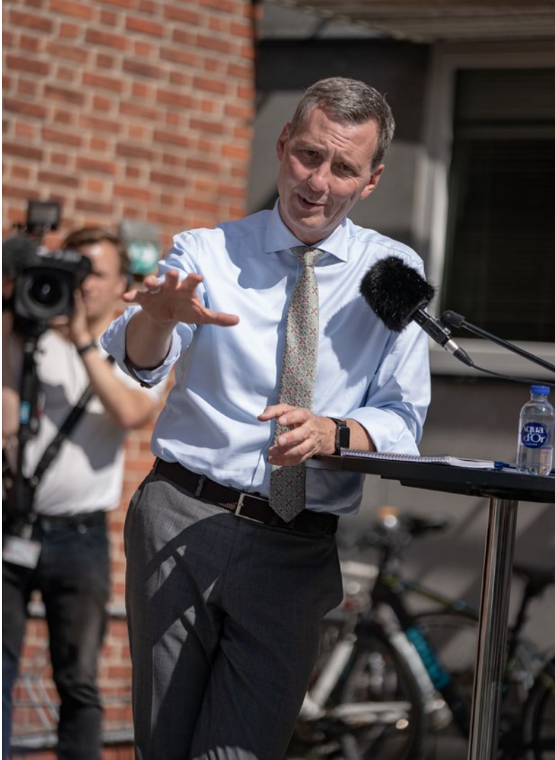
Justitsminister Nick Hækkerup fremlægger regeringens udspil på et pressemøde.

tes 20 nye nærpoltienheder fordelt over hele landet. De skal være bemanded med mindst fem politibetjente og have åbent mindst 15 timer om ugen, hvor borgerne kan henvende sig. Fra stationen skal betjentene også patruljere og være en del af gadebilledet, ligesom de skal samarbejde med skolen og kommunen. Nick Hækkerup tror på, at flere lokale betjente med et lokalt kendskab kan gøre meget for trygheden.