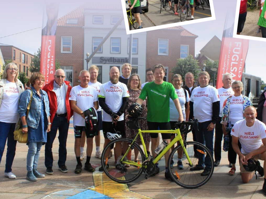
Cykelholdet nåede til brande torv i fin form.

Søde socialdemokrater serverede lagkage til cykelholdet i Langå.