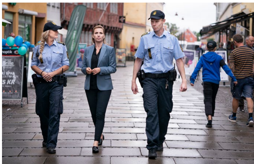
Statsminister Mette Frederiksen besøgte Køge Lokalpolitistation torsdag den 27. august 2020. Regeringen har lanceret et udspil til en flerårsaftale for politiet og i den anledning får statsministeren en rundvisning på stationen og følger en gående patrulje.