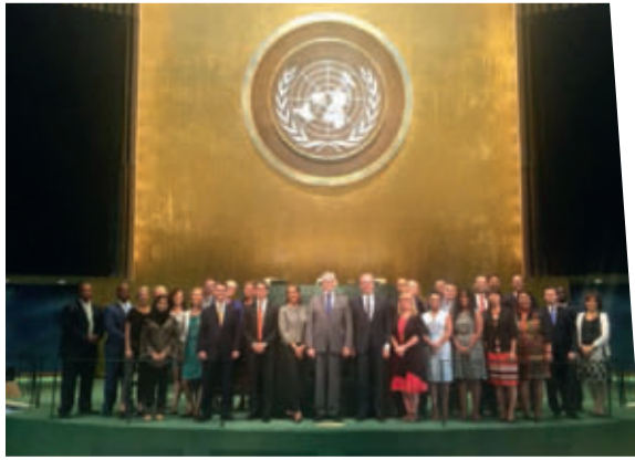
15. september tiltrådte Mogens Lykketoft officielt som formand for FN. Her er han sammen med sine medarbejdere – 30 gode folk fra 20 nationer.